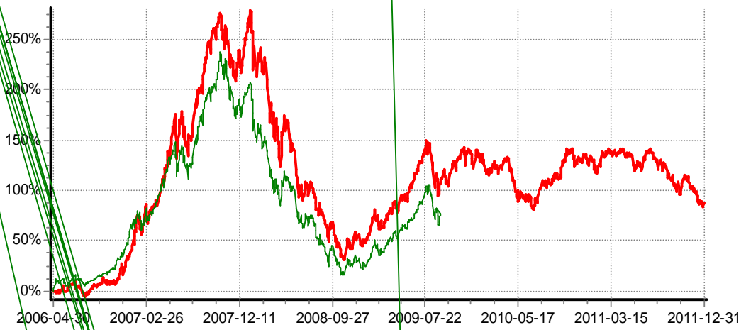
— 长信金利趋势股票 — 基金基准